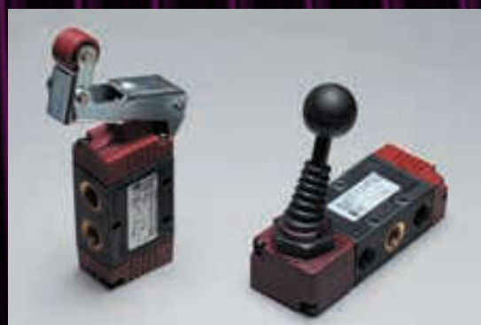
Válvulas 22 mm - 1/8" polímero